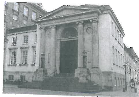
Supreme Court of Denmark